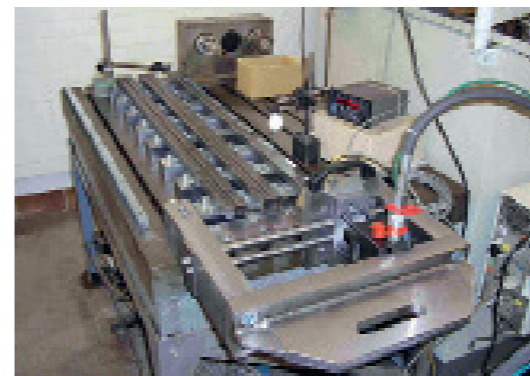
01 Atlanta Versuchsaufbau